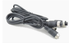
名称：防水延长连接线 规格：0.3-3米长 用途：灯具安装间距太远时的快速无损安装